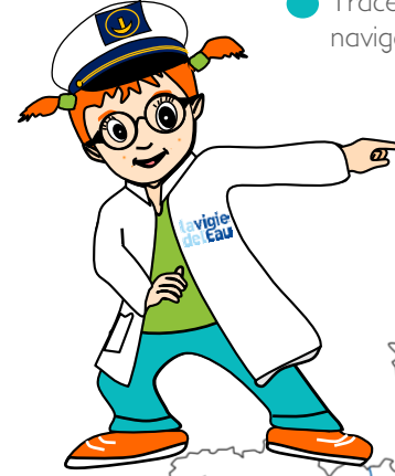
Carte des voies navigables