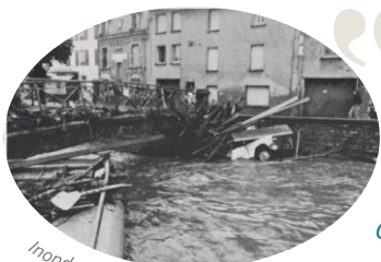
Inondations de 1975 à Vittel

Micros-trottoirs, enquête et témoignages - 168 réponses